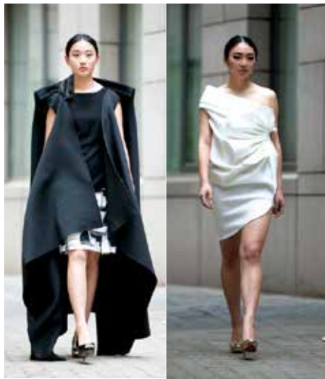
《服装造型设计》 选修课 任课教师：臧迎春、杨静、朱小珊